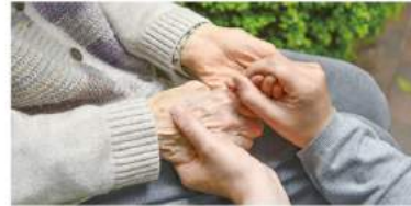
介護休暇・子どもの看護休暇