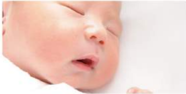
産前産後休暇・育児休業