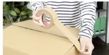
引越し移転費用支給（社内規定あり）